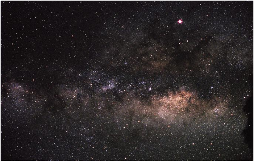
Image du ciel de La Palma prise le 20 Avril 2007, la même nuit de l'adoption de la Déclaration.